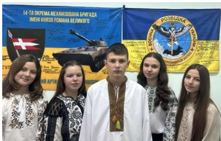
Пошукова група Буянівської гімназії – філії ОЗЗСО «Торчинський ліцей Торчинської селищної ради»

Волонтерство слід розглядати як практичний інструмент виховання активних громадян, здатних змінювати суспільство на краще.