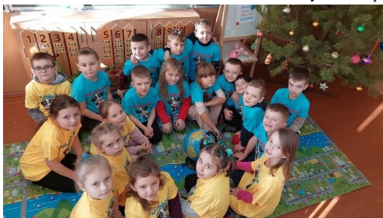
Рис 1 – ранкова зустріч

Молоді хлопці й дівчата в перший день війни взяли в руки зброю і стали на захист Батьківщини. Тисячі чоловіків повернулися терміново з-за кордону, щоб влитися до лав ЗСУ. Виявляючи героїзм, вміння швидко приймати рішення, реагувати на прояви ворожої агресії, наші воїни-герої залишаються людьми. Саме такими бачив майбутніх патріотів, захисників